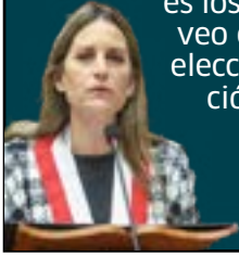
MARÍA DEL CARMEN ALVA PRESIDENTA DEL CONGRESO

“Con respecto a la bicameralidad, lo más rápido es los 87 votos, lo del referéndum lo veo complicado porque es toda una elección, es socializarlo con la población, explicarle de qué se trata”.