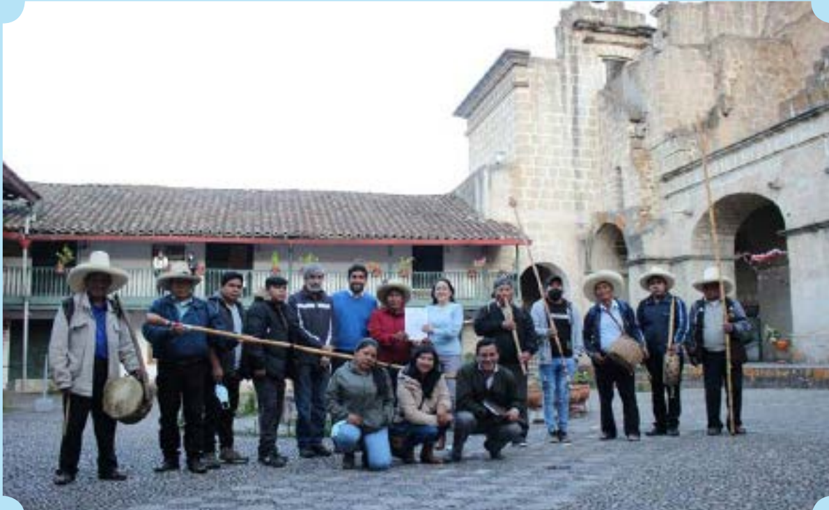
EQUIPO DE ENSUEÑO. Se logró y gestionó de manera conjunta, entre la Confederación de Clarineros y Cajeros de Cajamarca, la importante declaratoria.